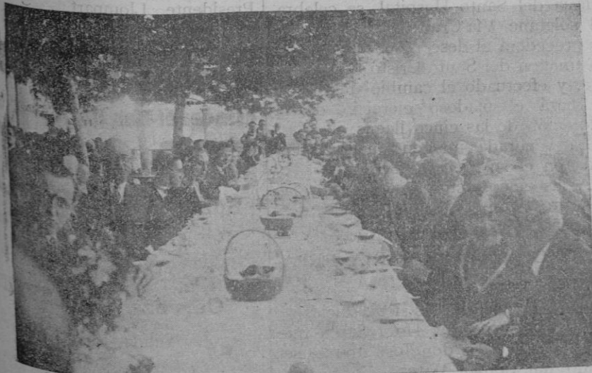
Comicia de compañerismo en el Hotel Victoria para celebrar la inauguración del Museo Pedagógico

En el fondo, si examinamos las dificultades, puramente parlamentarias, con que el Gobierno ha tropezado estos días, se advertirá, aparte del natural deseo de llegar al poder, que es legítimo y obligado si se quiere hacer