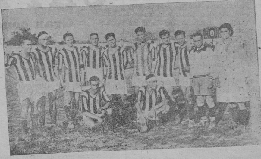
El equipo del Castellón que el domingo jugó contra el Constancio de Iruca, para el Campeonato de España