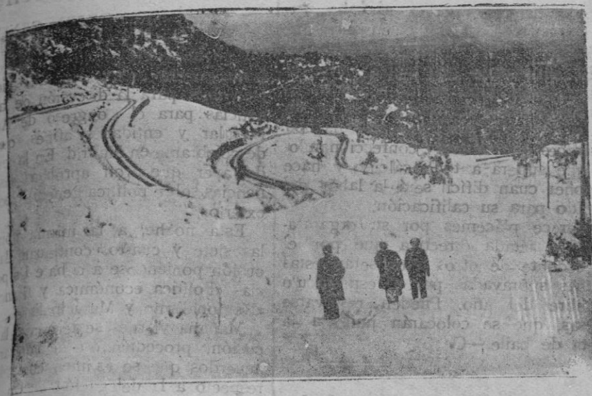
Esta superficie blanca, totalmente cubierta de nieve es de Coll de Sóller. En zig-zag, las huellas de los coches, con rales, un las cuestas de subida