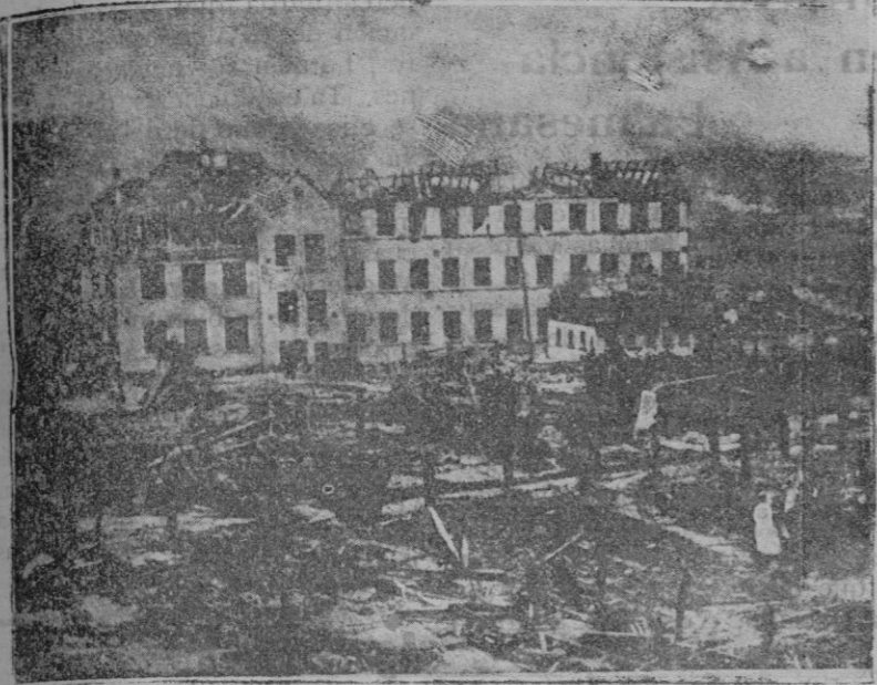
Estado en que quedó un edificio situado a 500 metros del gasómetro de las minas, después de la catástrofe producida por la explosión.