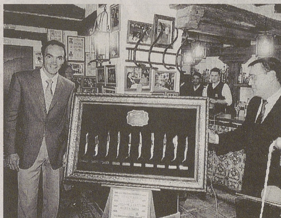
'El Cid' recibió el trofeo a la mejor faena en Albacete.