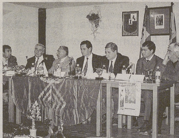
'El Regio', junto a otros invitados, en Huerta de Rey.