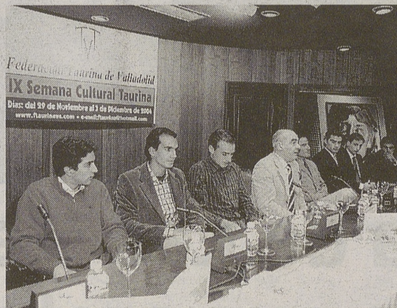
Mesa redonda sobre el estado de la fiesta en Valladolid.