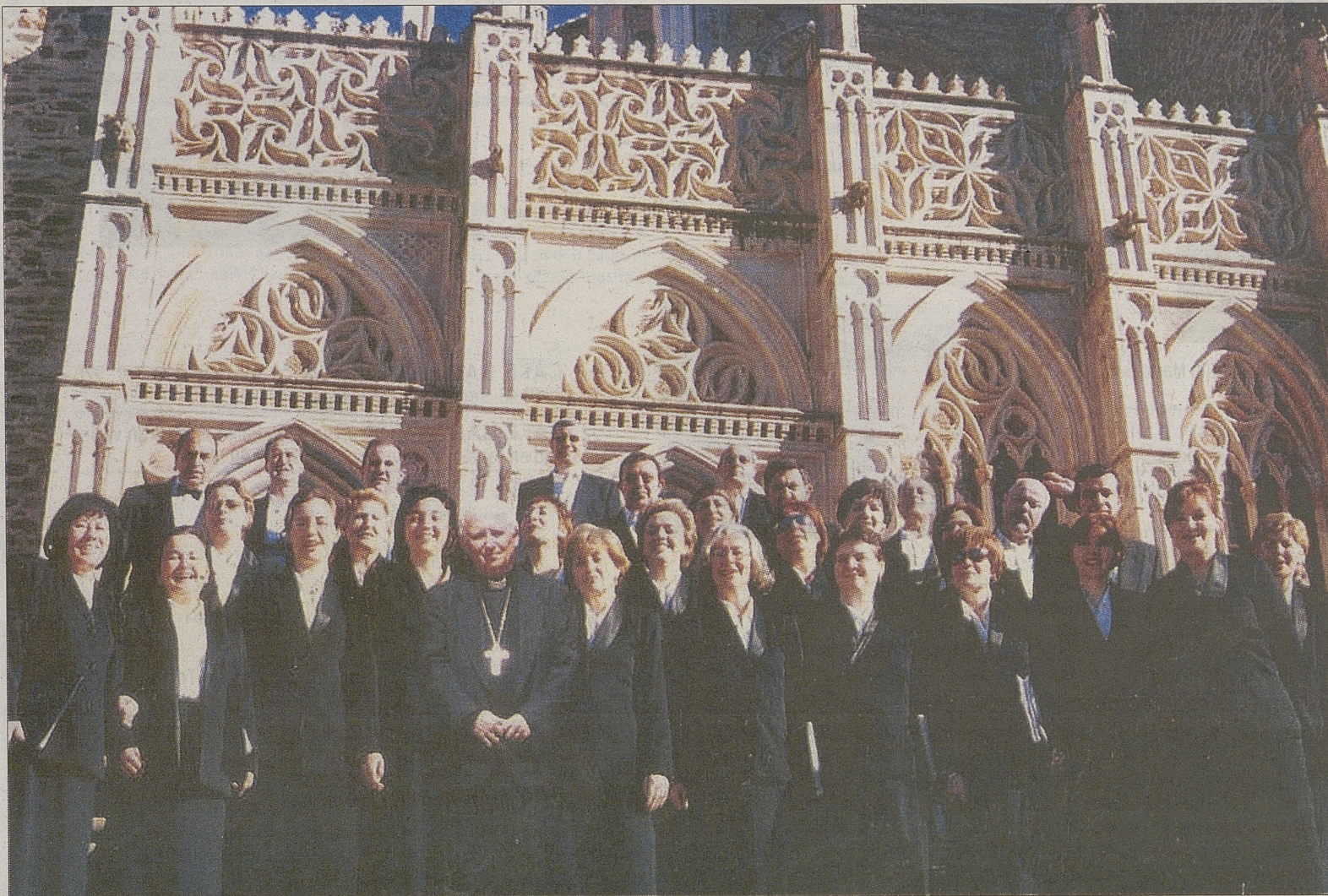
La Camerata Abulense ante la basílica de Guadalupe, tras una de sus actuaciones.