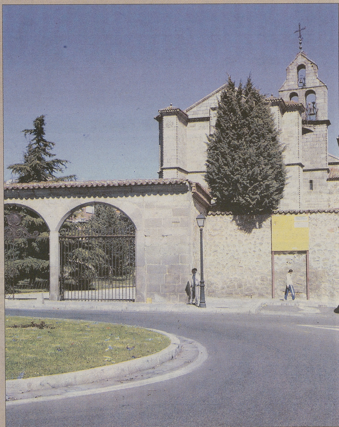
Vista del real monasterio de Santo Tomás desde la Plaza de Granada.

629.132 personas visitaron 'Testigos' durante las veinticuatro primeras semanas