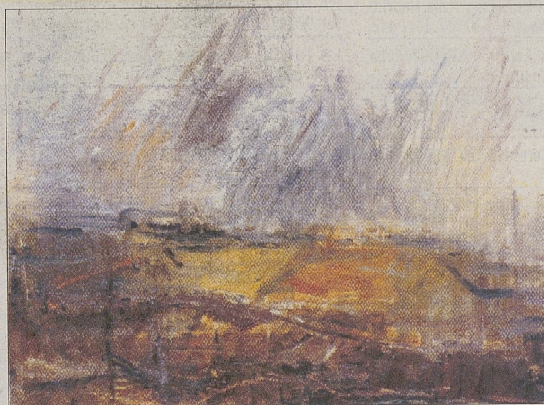
Detalle de la obra 'Paisaje Maraña'.

ves trazos pretende que se adivine el misterio de toda pintura, más allá de significados y significantes. Plantea un ámbito donde ocurren las cosas, por eso desprecia el informalismo; persigue, en suma, el descubrimiento de la pintura en sí misma, la que todo cuadro convoca más allá del anecdótico en que se concentra.