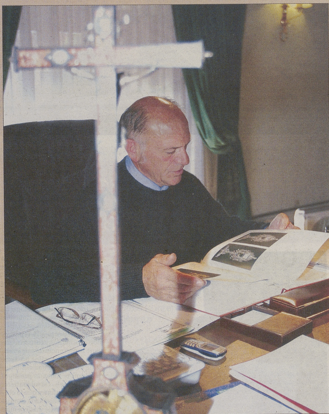
El presidente de la Diputación, Agustín González, ojea el catálogo de la exposición 'Testigos'.

629.132 personas visitaron 'Testigos' durante las veinticuatro primeras semanas