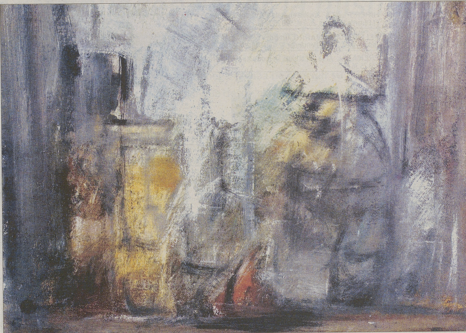
Fragmento de 'Bodegón', una de las obras de Guadaño seleccionadas para esta muestra.

Pintura. Sala de exposiciones del Casino Abulense. Visible a diario, de 12,00 a 14,00 y de 19,00 a 21,00 horas.