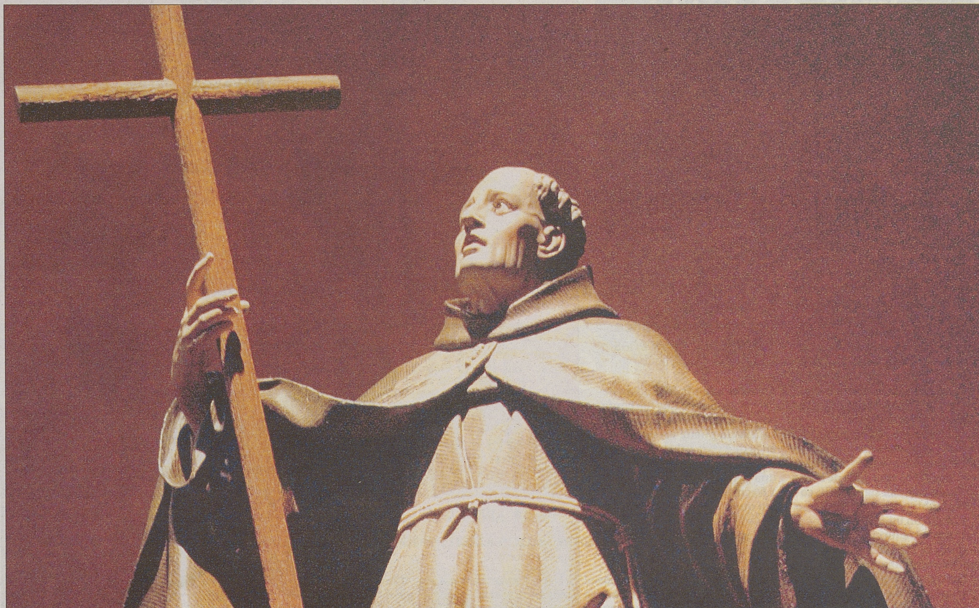
Detalle de la 'Glorificación de San Pedro de Alcántara'. Madera policromada. Luis Salvador Carmona. 1760. (Capítulo Sexto. 'El contrapunto de la acción: sólo Dios basta')./ RAÚL SANCHIDRIÁN