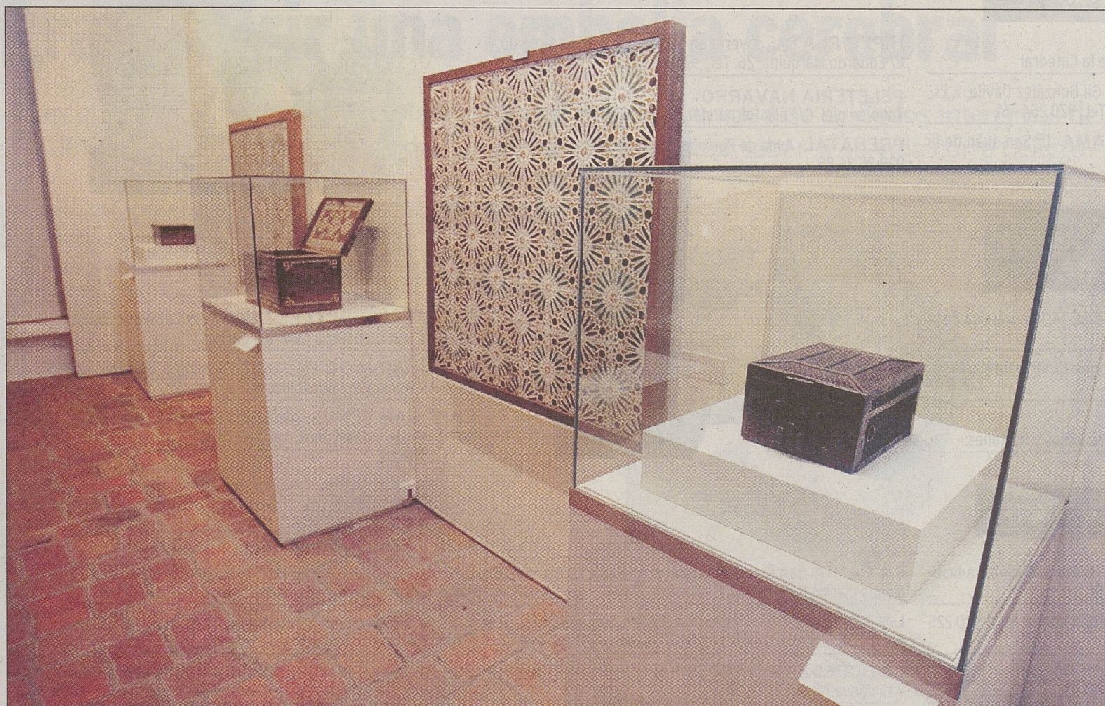
Una imagen de la exposición 'La Vida Palaciega' de Isabel I de Castilla, en el convento de Nuestra Señora de Gracia.