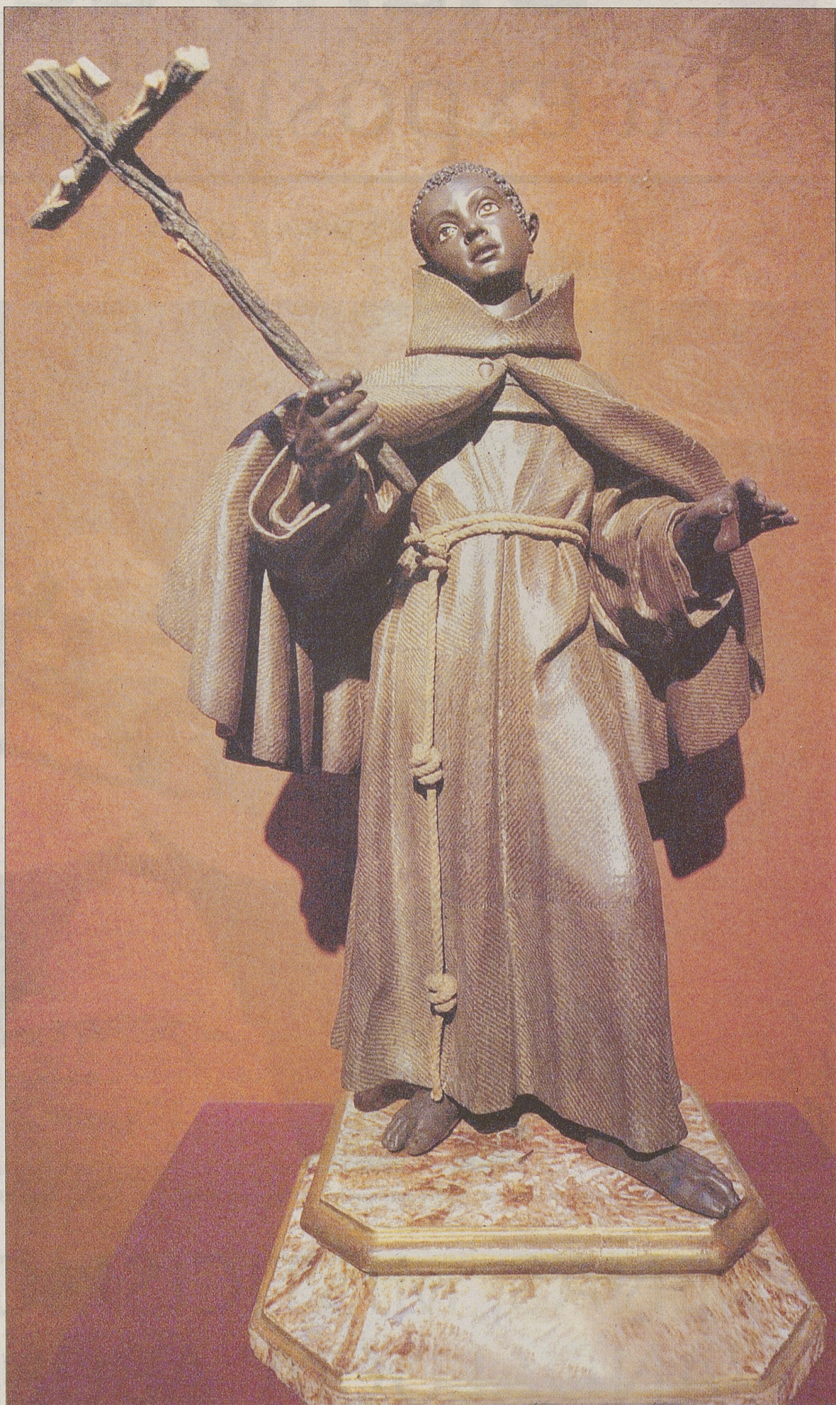
San Benito de Palermo. Madera policromada. Medios del siglo XVIII (Capítulo Cuarto. 'La osadía del amor').

Arquitectónicamente, destaca en Arenas de San Pedro la Real Capilla del Santuario de San Pedro de Alcántara, que fue construida a finales del XVIII sobre planos de Ventura Rodríguez, donde descansan los restos del santo titular en una de