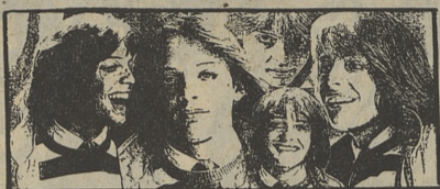
«No me puedes dejar así», LUIS MIGUEL