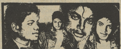
«Thriller», MICHAEL JACKSON