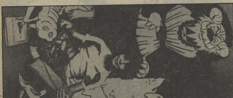
«Libro de aventuras», nueva serie infantil