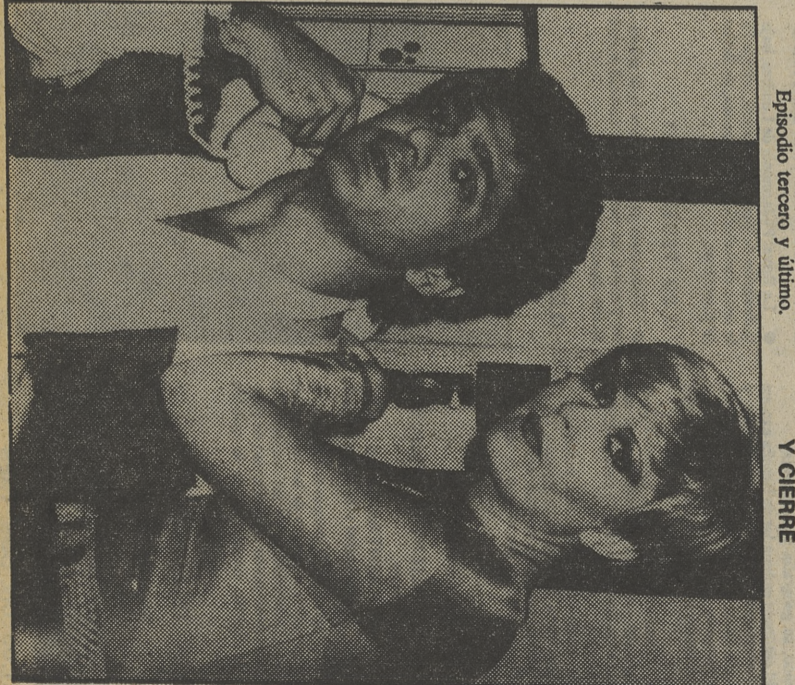
Barbara Rey, Angel Cristo y su circo a las siete de la tarde