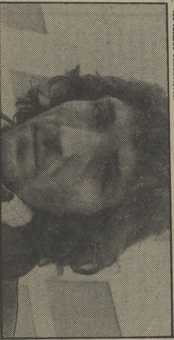
Hinjososa y «Los hijos del Sol»

23,40 ULTIMAS NOTICIAS 23,50 DESPESIDA Y CIERRE