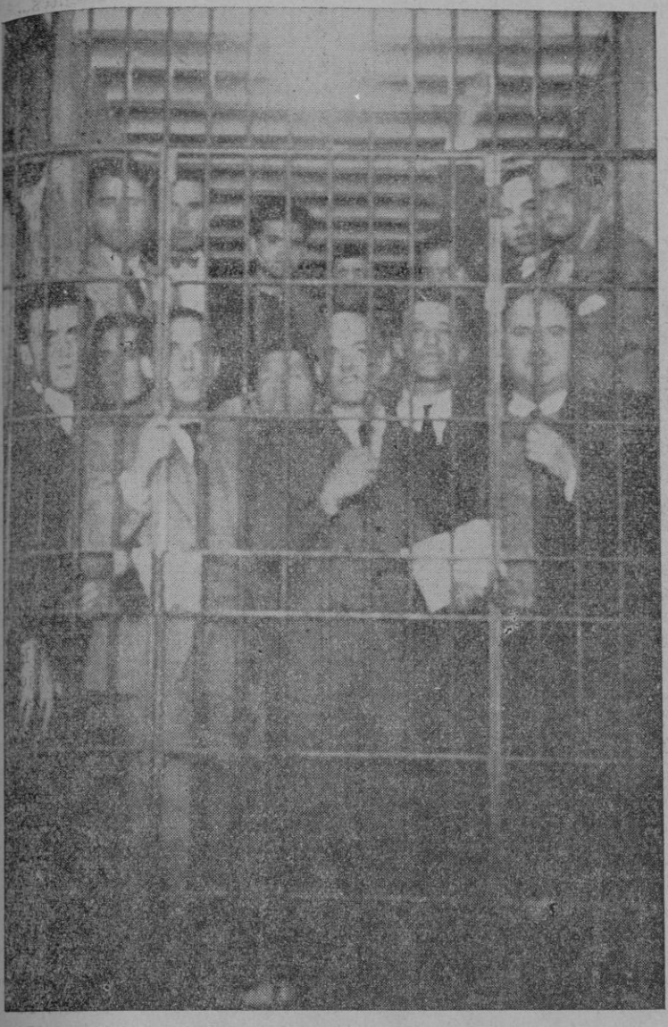
LA VIEJA GUARDIA SE HONRA EN LA CARCEL MARXISTA