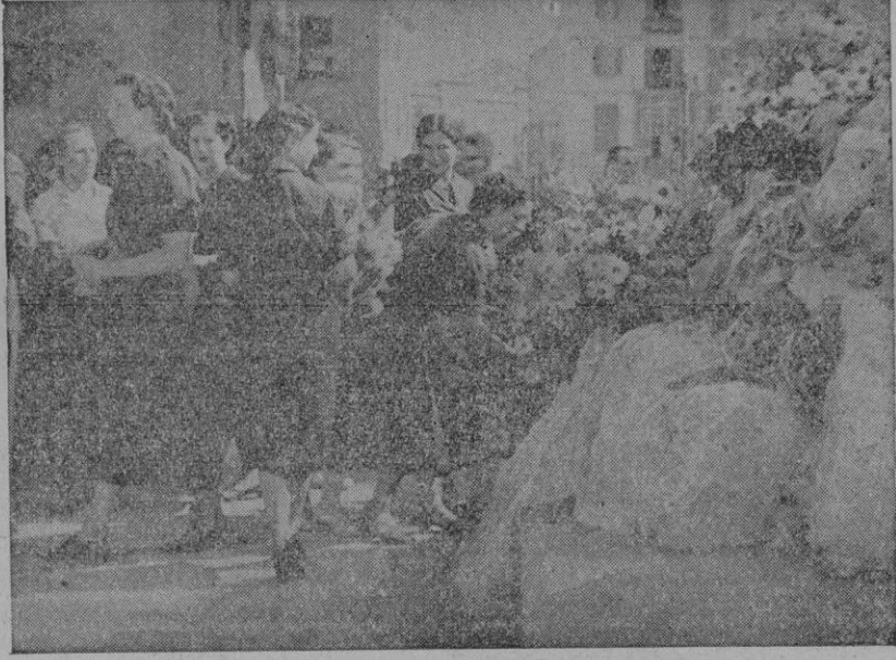
Y ELLAS DEPOSITAN FLORES AL PIE DE LA CRUZ

¡Cristo de Manacor!, vela por nosotros ahora y siempre.