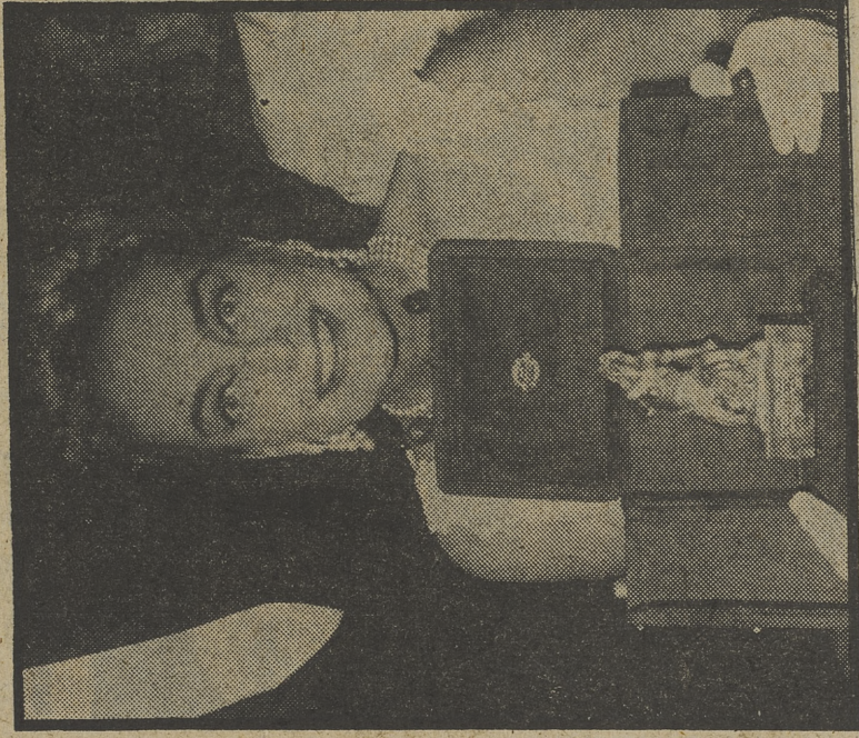
Joan Crawford ganó el Oscar por «Alma en suplicio»

Oscar 1945 mejor actriz a Joan Crawford. 23,35 TELEDIARIO Última edición. 23,50 DESPEDIDA Y CIERRE