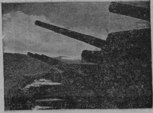
CAÑONES VIGILANTES SOBRE EL MAR

En aguas del Cantábrico, a las siete y media de la mañana del 30 de abril de 1937, el "España" era con una mina a la deriva de las innumerables que habían colocado nuestros mi-