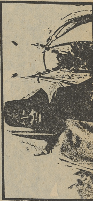
SANCHO GRACIA es ahora «La máscara negra».

Las vacunas han conseguido logros espectaculares, pudiéndose decir que son la columna vertebral de la medicina preventiva. Su último y más significativo triunfo ha sido el de erradicar la viruela.