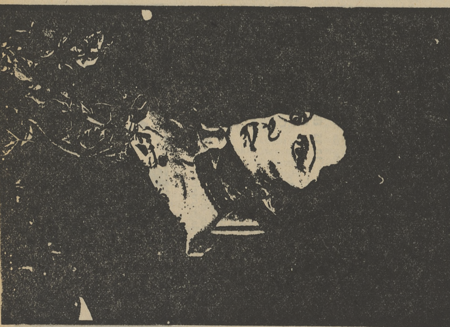
AMPARO RIVELLÉS, en «Los gozos y las sombras»