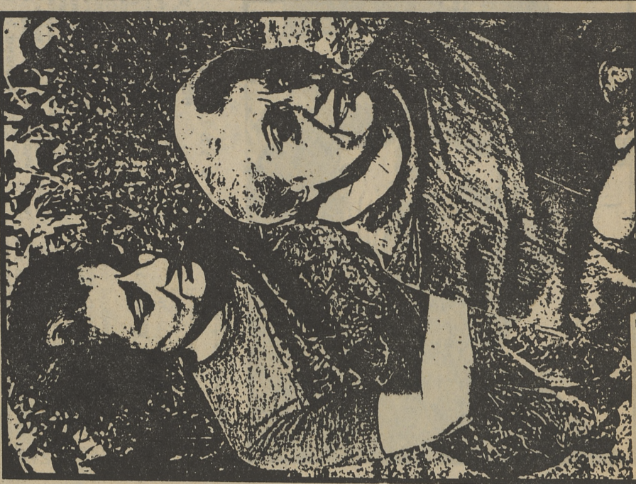
INDIRA GANDHI, protagonista de «Rasgos»

En tres ciudades separadas por muchos cientos de millas, dos mujeres a las puertas de la boda, y otra que no lo está, organizan un escándalo: el novio de una de ellas no acude a la ceremonia, nada al idénticas circunstancias, nada al novio a peso. Y tercera, que es novio de la segunda, se despidió porque está buscando, desesperadamente un hombre para casarse. Las tres necesitan poner mucha tierra —o mucha agua— por medio para mitigar, un tanto, los ardores de sus respectivos petipieles. Y acaban en la Marina, en el Cuerpo Auxiliar Femenino.