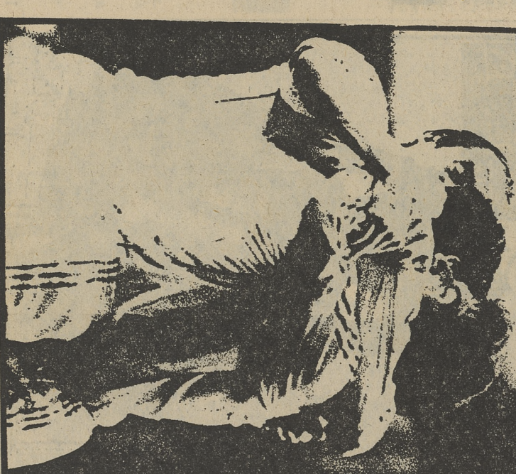
FINAL DE COPA DEL REY entre el Real Madrid y el Sporting de Gijón

6,30 APERTURA, PRESENTACION Y AVANCE INFORMATIVO