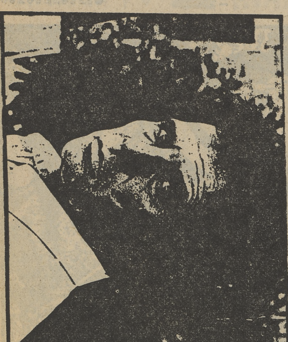
PACO RABAL, de torero en «Currito de la Cruz»