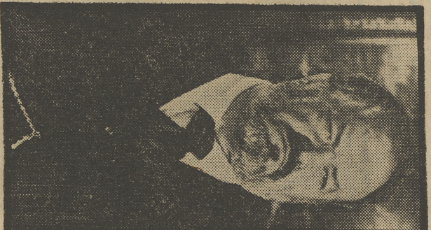
WILLIAM CONRAD -ANTES DE QUE YO MUERA».

Intérpretes: William Conrad, Lee Horsley y Allan Miller.