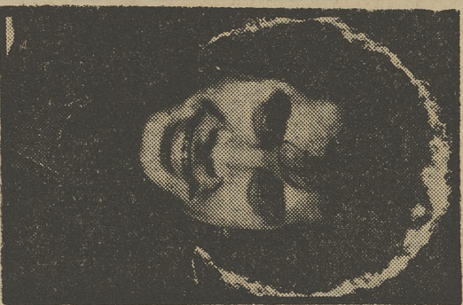
JOSE LUIS RODRIGUEZ

8,45 NOTICIAS 9,00 GRAN GALA DESDE EL MADISON DE NUEVA YORK