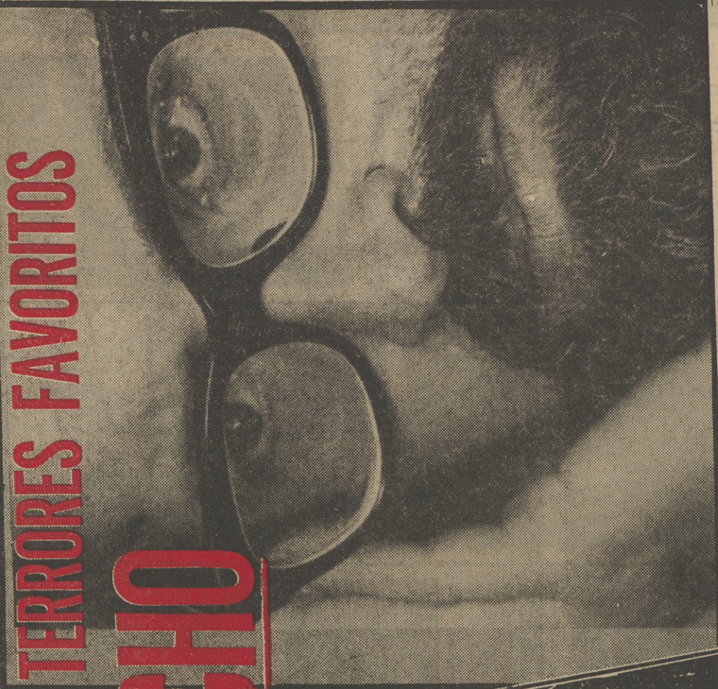
Tras “Tom Sawyer”

“VERANO AZUL” Serie juvenil dirigida por Antonio Mercero