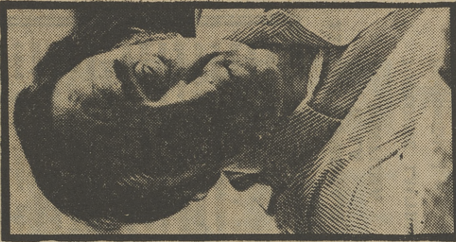
FERNANDO FERNAN GOMEZ

(Duración: noventa y nueve minutos.) Dirección: Pedro Olea. Guión: R. Azcona y P. Olea.