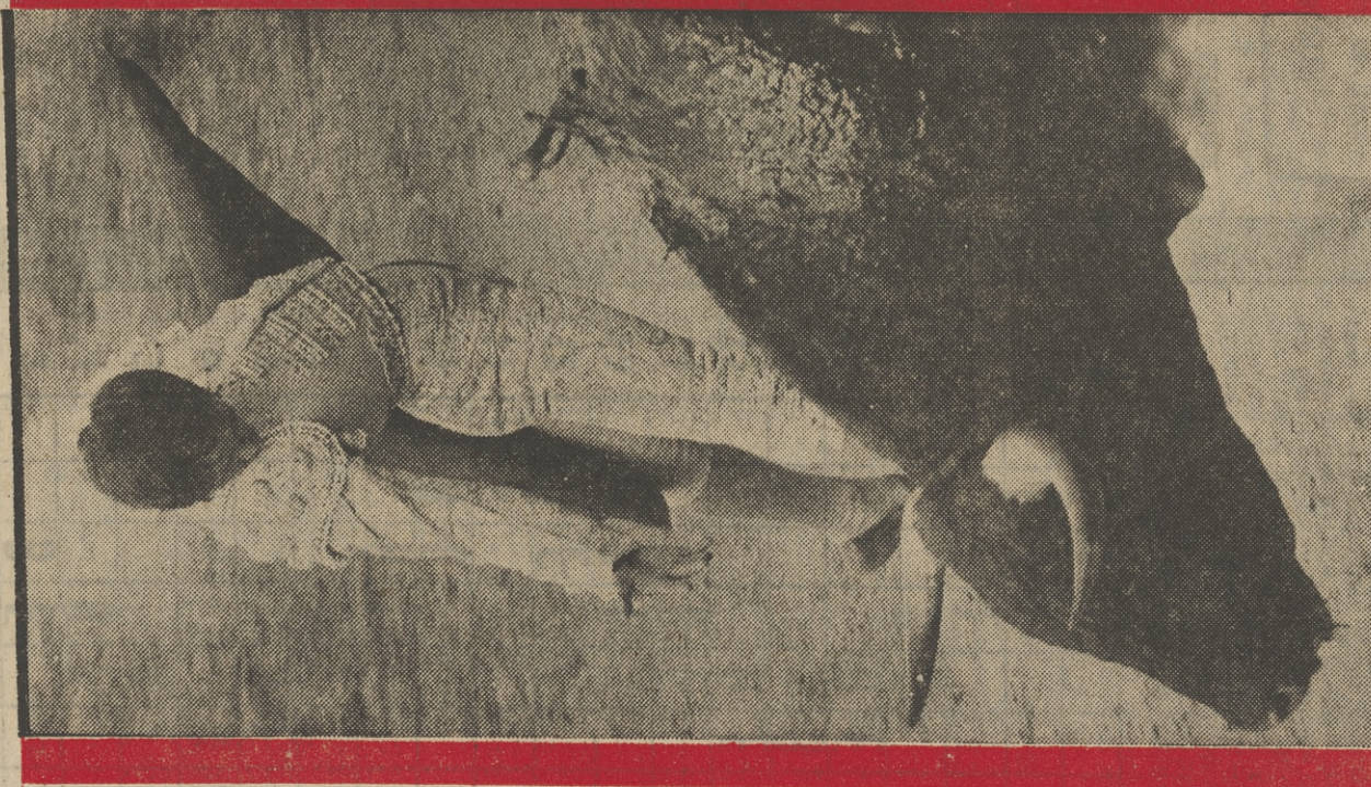
MARTES Y JUEVES

El inmediato martes da comienzo «El carro de la farsa», nuevo espacio teatral, cuyo objetivo es motivar a los espectadores en el descubrimiento, valoración y práctica del teatro, así como ofrecer un programa selectivo del teatro infantil y juvenil que se hace en todo el mundo. Por el programa irán desfilando diversos grupos teatrales.