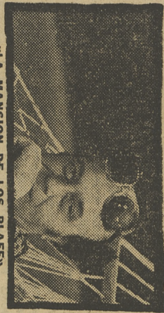
«LA MANSION DE LOS PLAFF»