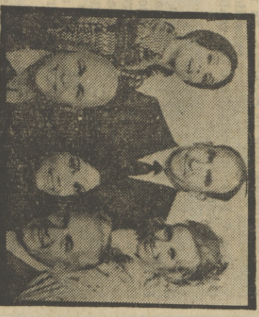
«LA CHICA DE LA TELE»

● Ted Baxter recibe con sorpresa, pero con verdadera alegría, una notificación de la oficina de impuestos en la que se le comunica la devolución de seis mil dólares. Con mayor sorpresa recibe cada uno de sus compañeros un regalo de buen precio por parte de Ted, que quiere de esta manera exteriorizar ante ellos su felicidad. 4,40 DESPEDIDA Y CIERRE (Color.)