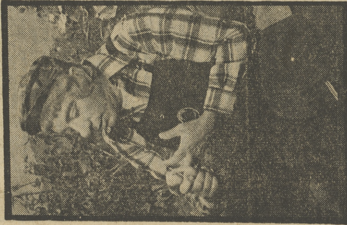
«EL CIRCO DE TV. E.»

Autores: Gaby, Miliki, Fofito y Milikito. Realización: Juan Villacusa. Interpretes: Gaby, Miliki, Fofito y Milikito. Gaby, Miliki, Fofito y Milikito presentan el gran circo de TVE, con las habituales atracciones circenses y el divertido concurso, en el que parejas de niños compiten en distintos juegos. Gaby, Miliki, Fofito y Milikito presentan además una aventura cómica y sus alegres canciones.