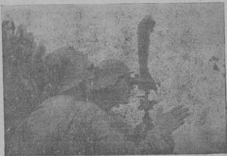
Un aspecto de nuestras líneas atrincheradas que refleja el moderno y magnífico material guerrero de que están dotados nuestros soldados