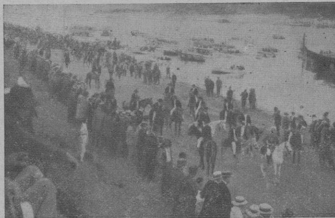
«Típica Colcada» en es Cos Nou en 1928.--Para las Carreras de Caballos.

De esta época son las hermosas ménsulas en que descansan las bóvedas de la Ermita, que representan la Anunciación y los cuatro símbolos de los Evangelistas, entre follajes, y también las claves de la bóveda, que llenan las figuras de Santiago y S. Jorge, formando todo ello una de las pocas muestras de escultura gótica que existen en Menorca, comparables con las recientemente de cubiertas en las puertas de la S. I. Catedral, siquiera no las superen en antigüedad ni mérito.