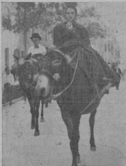
Típica "Colcada" de Trajes a la Antigua Usanza 1942