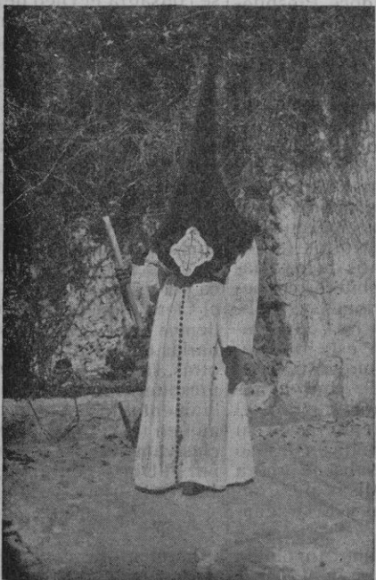
Cofrade de Jesús Nazareno

Cuando enfilaba la procesión las calles estrechas, más surgía la idea del pasado. La imagen del Nazareno y las andas ocupaban todo lo ancho de la calle, y su rítmico balanceo nos hacía entrever los capirote morados de los cofrades silenciosos que rezaban en voz apagada los Padrenuestros del Via-Crucis.