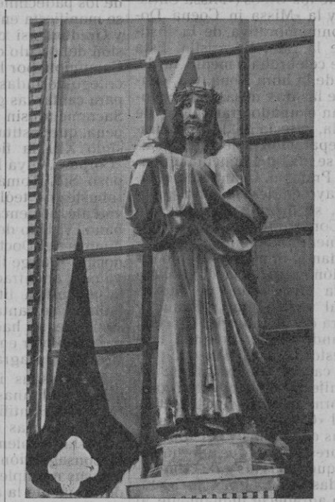
Imagen de Jesús Nazareno

Sus andas del paso que contienen la imagen de Jesús Nazareno, confeccionadas en los talleres Jaime Arnau, de Ciudadela, están atravesadas por ocho varas que