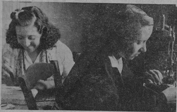
Bellas aparadoras preparan los cortes con el más exquisito primor

Solo unas palabras más sobre Pe- dro Cortés. Aquella nueva industria que en 1860 es acogida con expecta- ción e incredulidad en Ciudadela se ha desarrollado. Ya son muchos los trabajadores que ven su porvenir por buen camino. Ya el mercado de América, de toda América, le ha abierto sus puertas al calzado ciuda- delano. Mas la peste y el cólera aso- lan los países, la situación en Cuba es incierta y se palpa la insurrección. La demanda de zapatos disminuye y Pedro Cortés ve a sus hombres un ndiale