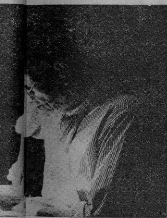
s antes, trabajan febrilmente en las ocer lable demanda...

u inte la fiesta de la Candelaria de esfalle. Ciudadela aparece cubierta de iz y aco manto de nieve. Pedro Cortés