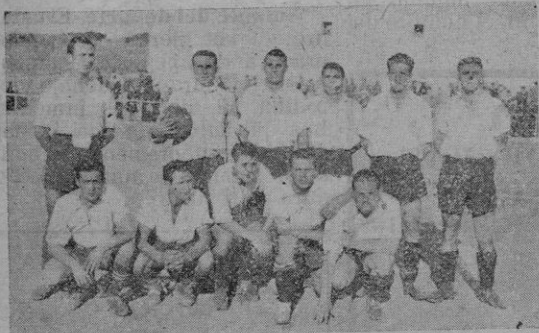
El potente once del C. D. Mercadal que mañana se enfrentará con el C. D. Alayor

ALAYOR Y MERCADAL JUGARÁN UN GRAN ENCUENTRO