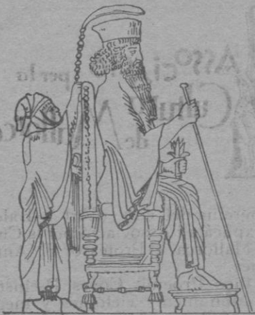
Perria Xerxes en su trono

Eridú debió estar al principio de la lengua de tierra, «al borde de las