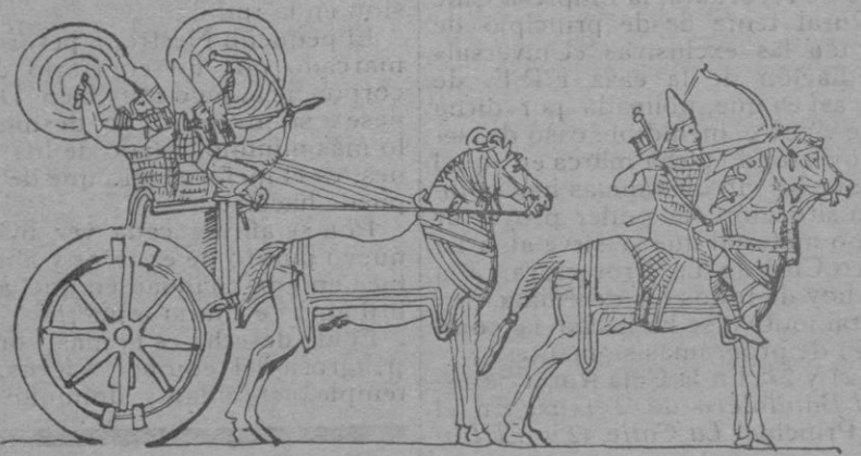
Carro de combate arrio del siglo VII a de J. Relieve de la campaña de Senaquerib.

La Tierra, en el principio, estaba sumergida en pantanos. La historia de