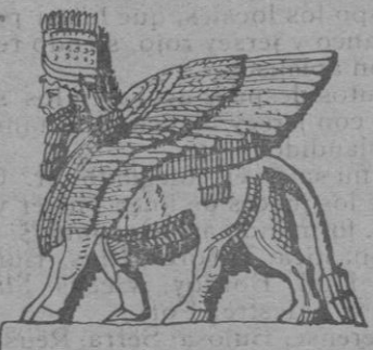
Soro alado de Korsabad

Se discute la antigüedad de Egipto y Mesopotamia y se ha venido en fijar el