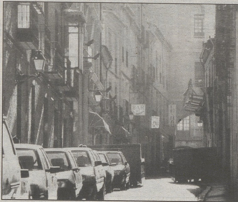
A la izquierda, Calle Vallespín; a la derecha, Mercado Chico.

Delante del altar mayor, estauan dos blandones grandes de plata, de