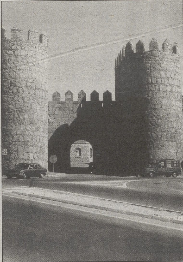
Puerta del Puente, en la Muralla.

Esta procesión en la manera que se ha dicho, y lleuando dentro della la capilla de cantores y ministrales en gran número, con gran música dellos y teclas: y assí mismo con muchas y muy luzidas danças, con que en esta traslación siruieron los seismos de la tierra de Ávila, y rigiendo esta procesión algunos preuendados en la santa iglesia de Ávila, con bastones plateados, y algunos cualleros della con bastones dorados, fueron con mucha magestad, solenidad y deuoción, desde la misma iglesia mayor de Ávila a dar a la calle de la pescadería, y desde allí a la calle que baxa al monaste-