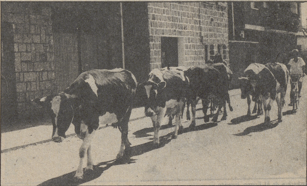
Arriba, panorámica de El Fresno. Abajo, una estampa diaria, las vacas pasando por las calles VICTOR GONZALEZ