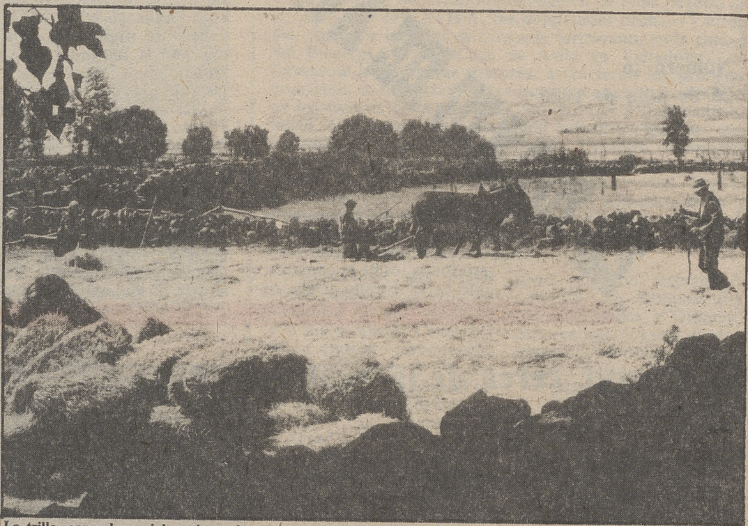
La trilla, como hace siglos, sigue viva

Paseamos por un pueblo fantasma, por un pueblo que está allí, delante de nosotros pero que, en realidad, ya no existe. A la vuelta de una esquina aparece un pastor