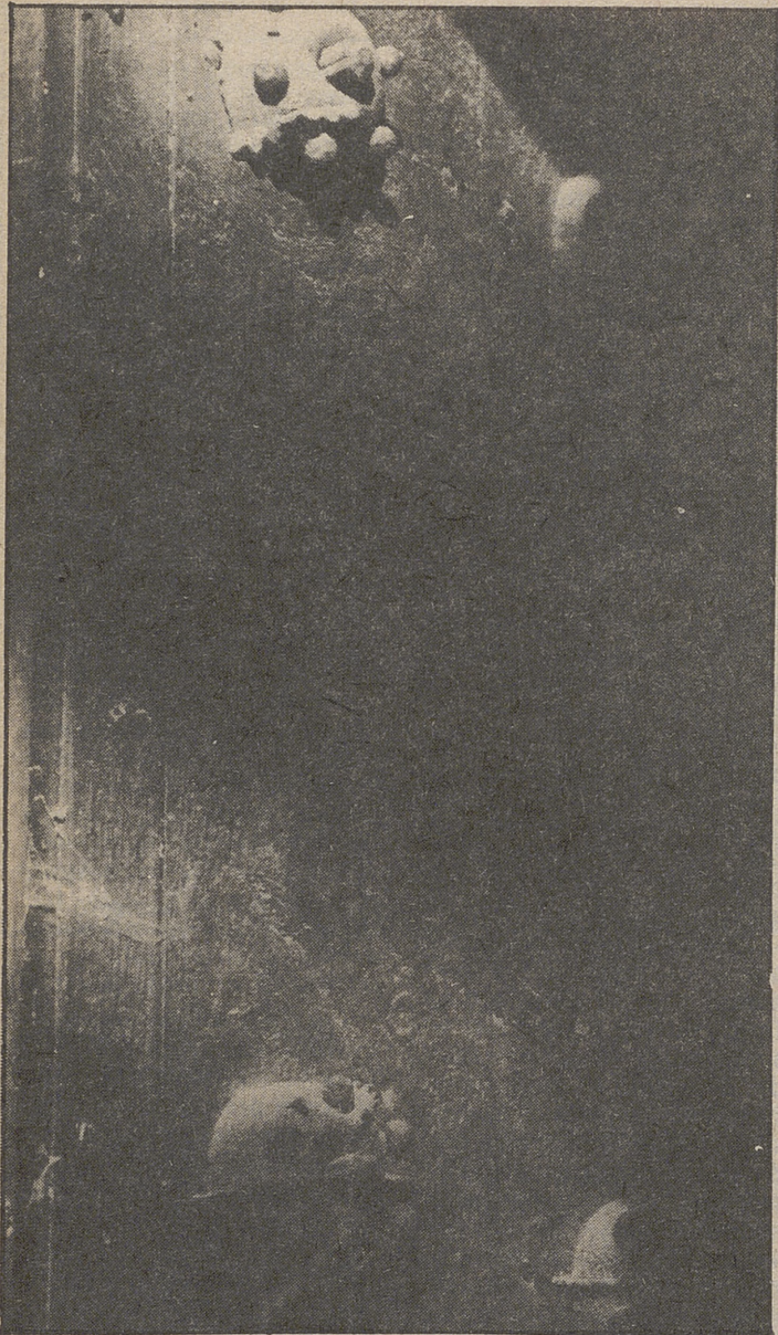
Puerta del palacio de los Verdugo