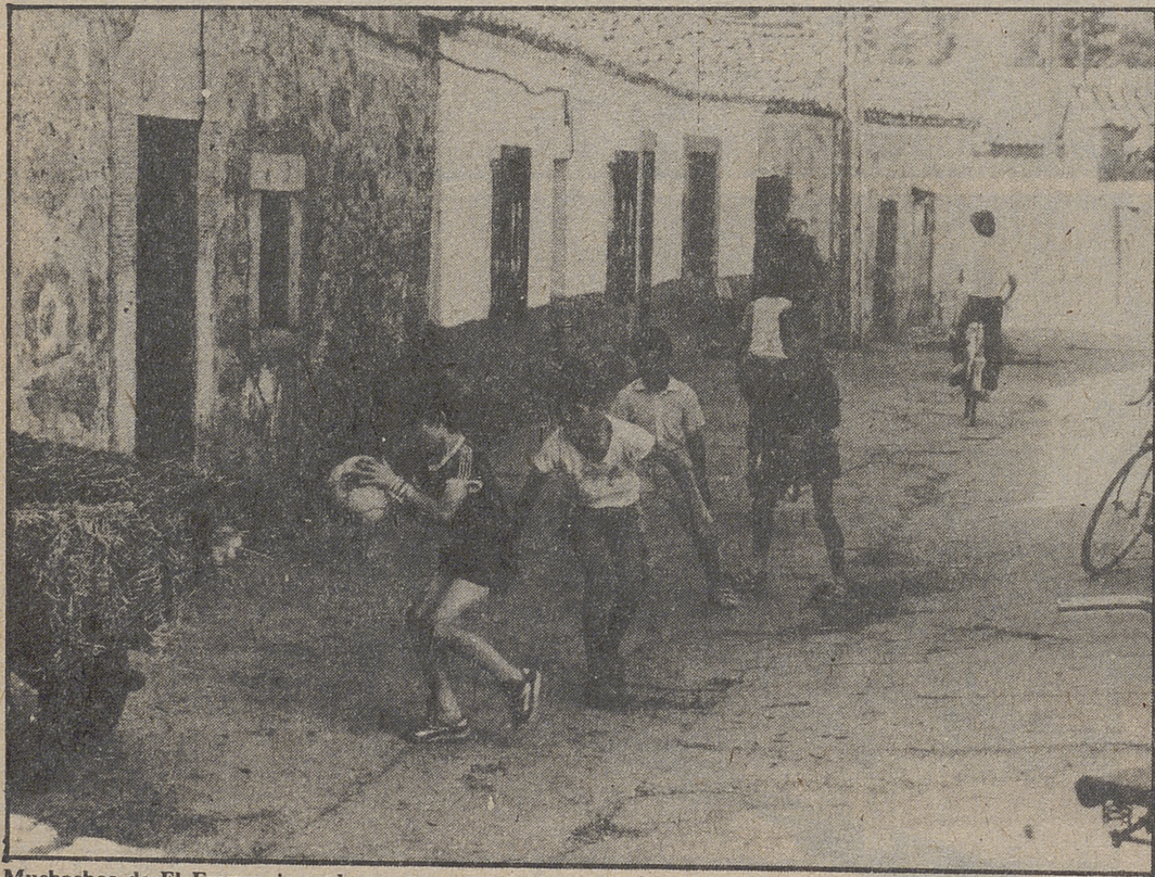
Muchachos de El Fresno, jugando

deja de ser un pueblo bonito, porque es un pueblo típico, con pocas y estrechas calles y con casas abandonadas y lugares donde aún se guardan los animales que, con el viento, son los únicos que viven allí.