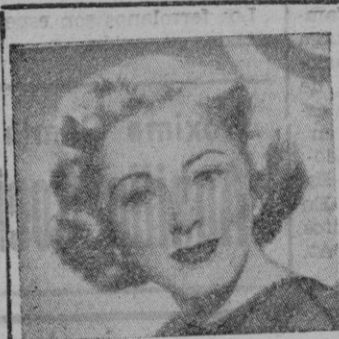
ELEANOR PARKER que sufrió en su felicidad un disgusto por un error de juventud

le ofrece con plena garantía el éxito de sus servicios AVIONES - RECEPCIONES COCK-TAILS A domicilio o en sus salones 529