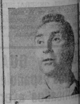
HORACE Mc MAHON Un hombre justo comprende los errores del delincuente

La historia de un detective que seguía la pista de su desgracia