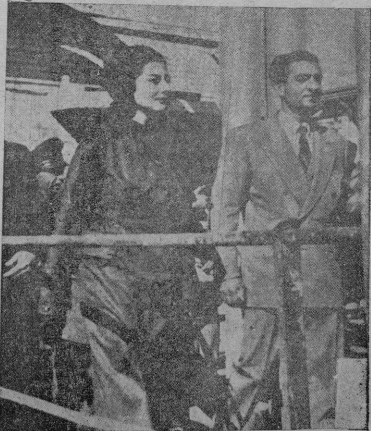
ABADAN. — El Sha de Persia, acompañado de la reina Soraya, visitan las instalaciones petrolíferas de la localidad, casi paralizadas por el conflicto angloperseo.