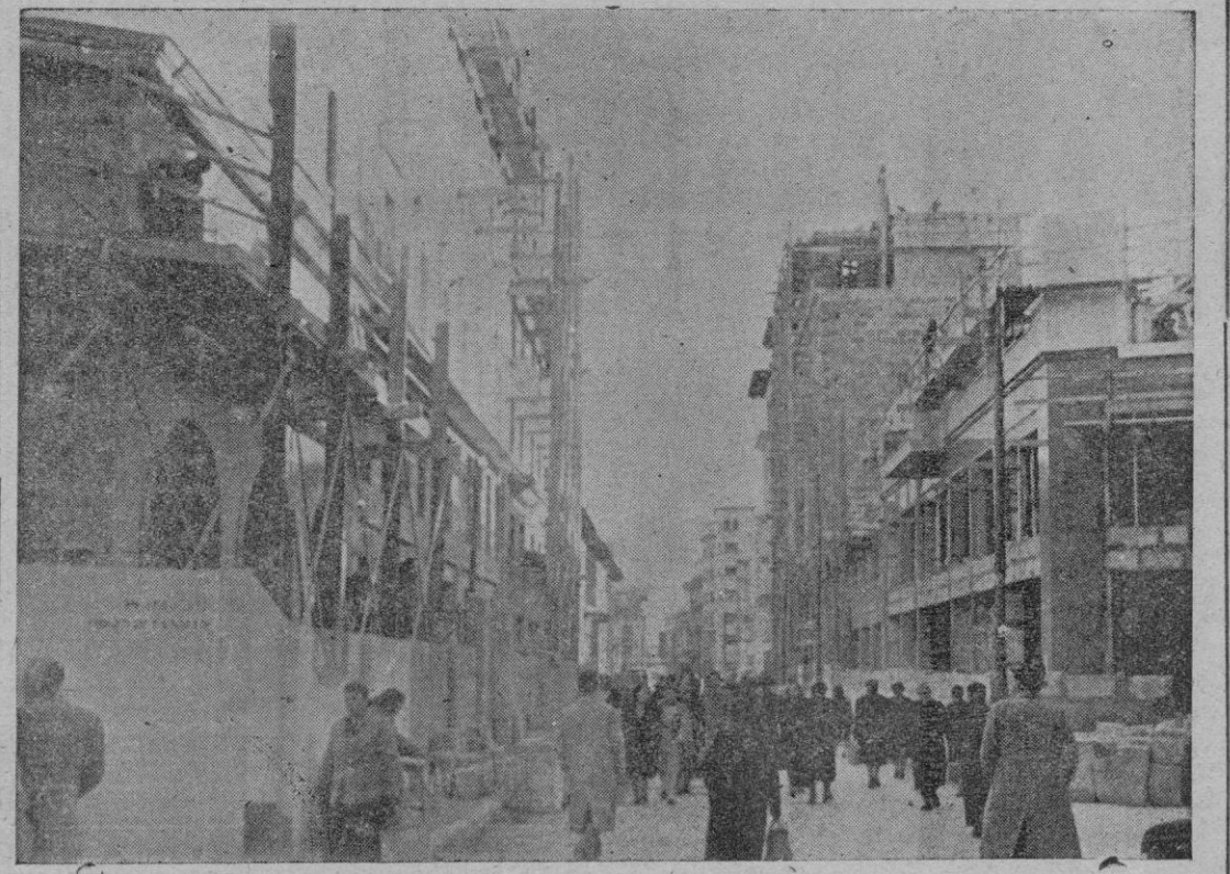
La nueva y espléndida calle que desde frente al templo de San Miguel sigue hasta las Avenidas y cuyos edificios han sido construídos en breves meses.