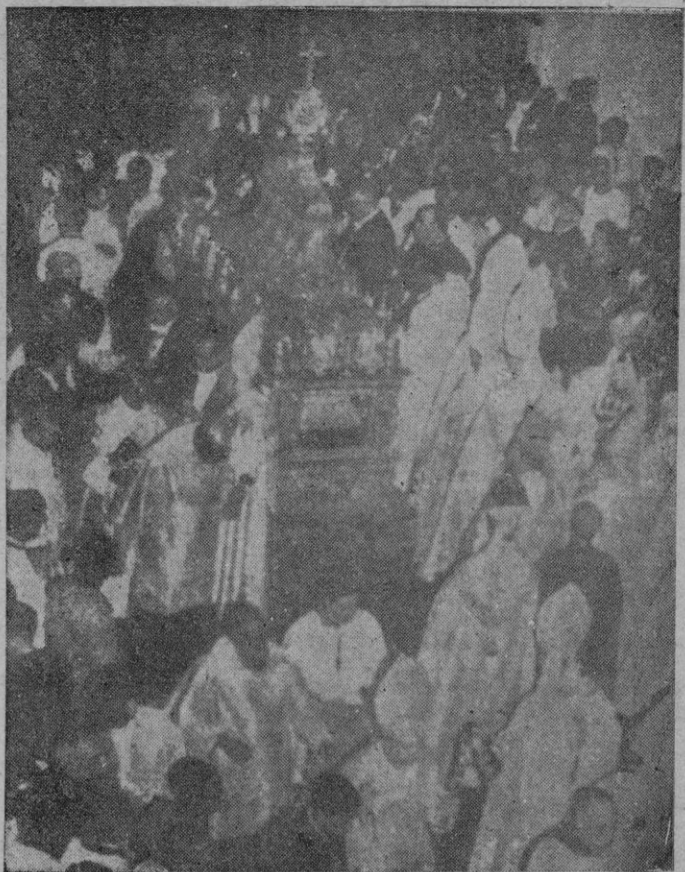
Detalle de la solemnisima procesión en la que era llevado en preciosísima arca el cuerpo incorrupto del gran santo español