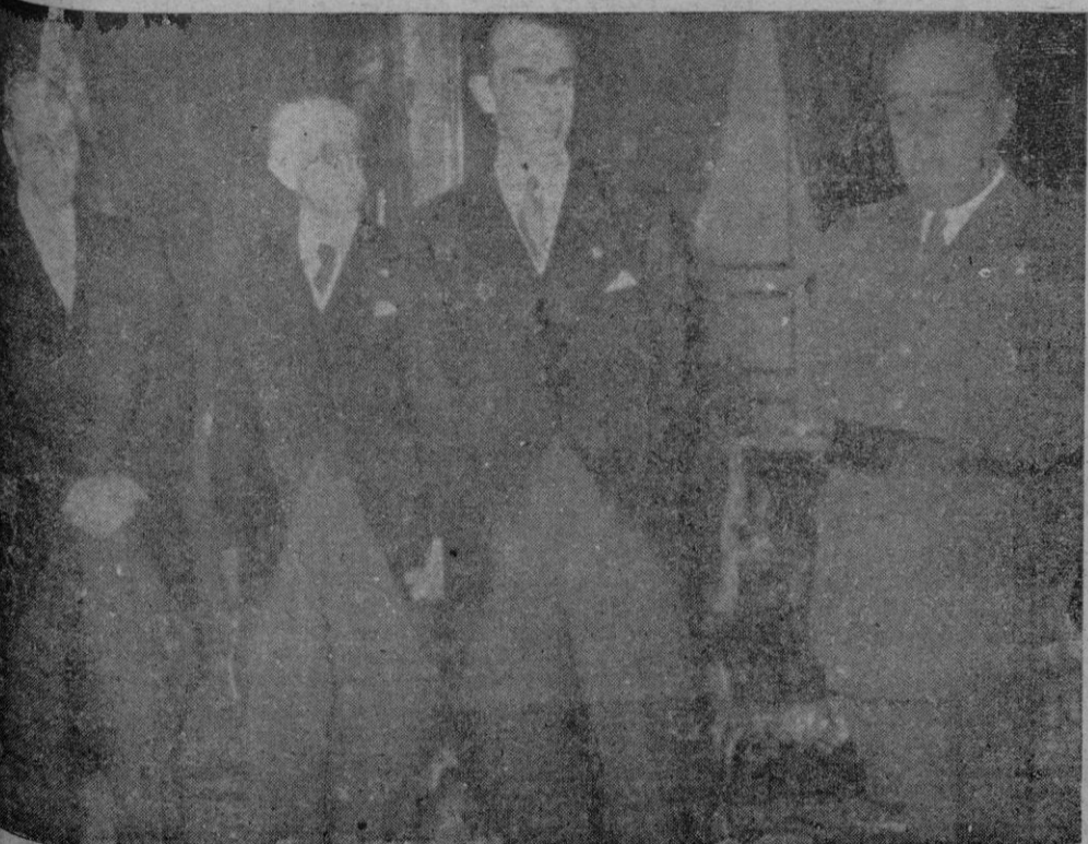
Comisión de la Junta del Museo del Prado, presidida por don Rafael Sánchez Mazas, en visita de salutación a S. E. el Jefe del Estado