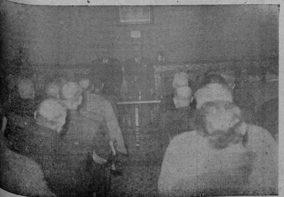
Aspecto de la sala de Juntas durante el trascendental acto celebrado el sábado bajo la presidencia del Sub-gobernador del Banco de España.