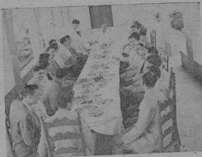
Un detalle del agasajo ofrecido por la "Iberia" a su personal

Todos los años, con ocasión de celebrarse la conmemoración de nuestro Glorioso Aniversario Nacional, la Compañía "Iberia Líneas Aéreas de Transportes" celebra con sus empleados y con cuantos colaboran a la mejor eficacia y difusión de sus servicios, esta efeméride.