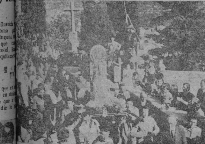
Detalle de la solemnisima procesión celebrada el domingo en Artá, con motivo de retornar a su Santuario, la imagen de la Virgen de San Salvador