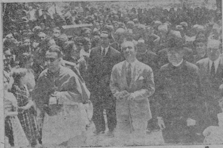
El Excmo y Rdmo Sr. Obispo, el Excmo. Sr. Gobernador Civil y Jefe Provincial del Movimiento y otras autoridades asistiendo a los solemnes actos celebrados el domingo en la villa de Artá

mino, el señor Obispo bendijo la Cruz de los Caidos, pronun- ciando elocuentes palabras de homenaje a los caídos el señor Gobernador Civil, siendo sus últimas palabras ahogadas