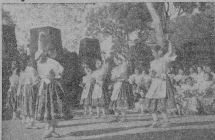
El grupo de anzas de Cieza (Murcia), sue participará en el III Certamen Folklórico Internacional que se celebrará en nuestra ciudad

Acheson y Eden llegaron Bonn para firmar el tratado de Paz con Alemania