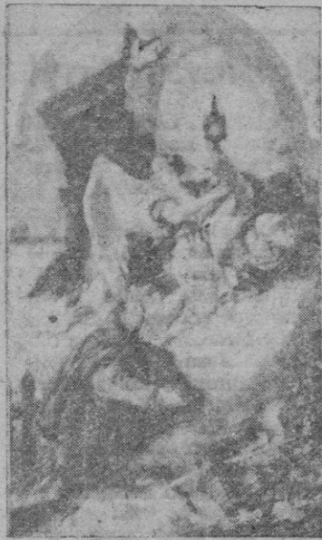
S. Pascual Bailón, Patrono de los Congresos Eucarísticos, adorando a la Eucaristía. Grabado antiguo en que aparece completo el proyecto del famoso cuadro de Tiepolo "La Eucaristía" el cual se guarda en el Museo del Prado

Los polacos, junto con todos los de las demás naciones de allende el telón de acero, celebrarán una misa de medianoche en la Basílica de la Merced y tomarán parte en la adoración del Santísimo en la Catedral y en la gran procesión.