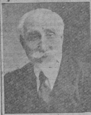
Don Antonio Maura

teciendo al país; las otras, de carácter económico, al no poder permanecer indiferentes ante los problemas monetarios que a los diversos países plantea el hecho de tener que ser tributarios de fletes a otras banderas.