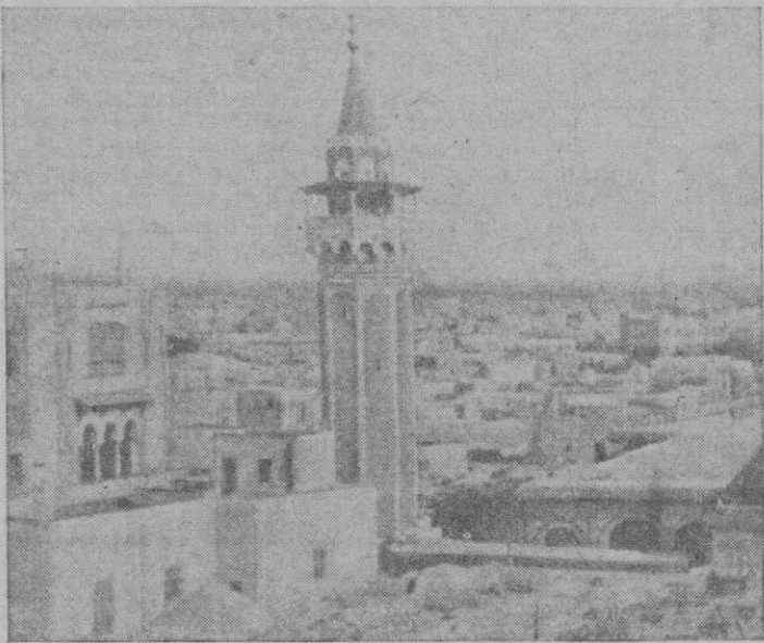
Vista parcial de la ciudad de Túnez

Residente General que no visitase hasta el viernes, en vez de hacerlo hoy como había solicitado el último. Se añade que la audiencia se