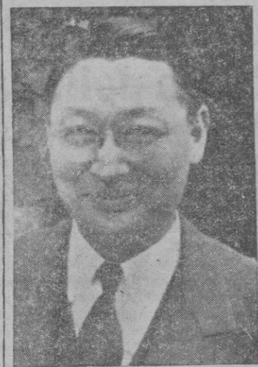
KIYU HONG CHYUN, Embajador de Corea en París

leo y compruebo que en Italia, en Francia y en otros países europeos hay millones de afiliados al comunismo, no puedo apartar de mi mente la idea de que la inmensa mayoría de tales afiliados no saben exactamente lo que es el comunismo. Lo sabrán en teoría, habrán leído lo que se publica en libros o revistas comunistas; pero