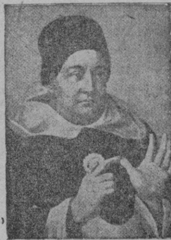
Santo Tomás de Aquino, Patrono de las escuelas y de los estudiantes católicos

Como de costumbre, las ilustres representaciones llegaron a Palacio en carroza, escoltada por el escuadrón de la Guardia Mora, penetrando por la Plaza de Almería, donde les fueron rendidos honores por fuerzas del Regimiento de la Guardia de S. E., mientras la banda militar interpretaba los correspondientes himnos nacionales.