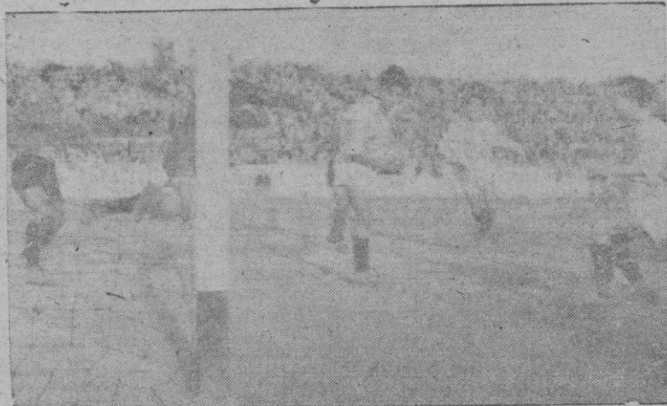
El gol del Atlético Baleares

Ya dijimos por qué no nos agrada el arbitraje que perjudicó al equipo mallorquin.