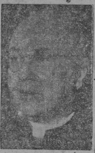
lucha en Corea, que ha durado tres días. En los diversos puntos que ha visitado valiéndose del avión, el helicóptero y el jeep, el Cardenal Spellman ha conversado con los soldados y ha celebrado misa cinco veces.

Seul, 25 (Efe). — El Cardenal Spellman arzobispo de Nueva York ha dado por terminada su visita de navidad a los frentes de