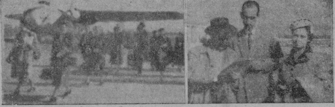
Llegada al Aeródromo de Son Bonet de los directores de las Agencias de Turismo norteamericanas.

Los resultados alcanzados son bien proficeros, hoy el 73 por 100 de los secretarios del tercera categoría proceden del Instituto de Estudios de Admi- nistración Local; y el 41 por 100 de los Interventores de fon- dos; el 25 por 100 de los depo- sitarios; el 14 por 100 de los Secretarios de primera cate- goría.