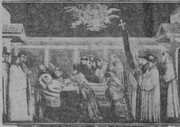
"La muerte de San Francisco de Asís", fresco de Giotto existente en la iglesia superior de la basilica de Asís

En estos tiempos de materialismo, ¡Cuánto bien hace el alma meditar sobre el amor de San Francisco!