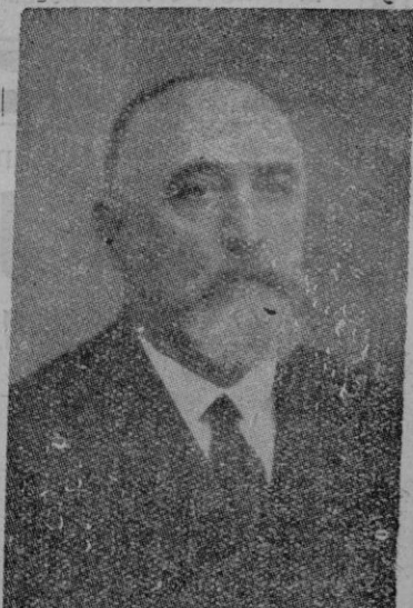
Don Severino Aznar, patriarca de la Acción Social en España

Produjo emoción la lectura de una carta del Santo Padre al nuevo caballero de San Silvestre, en la cual pone de relieve que "por haber dedicado con diligente perseverancia tus