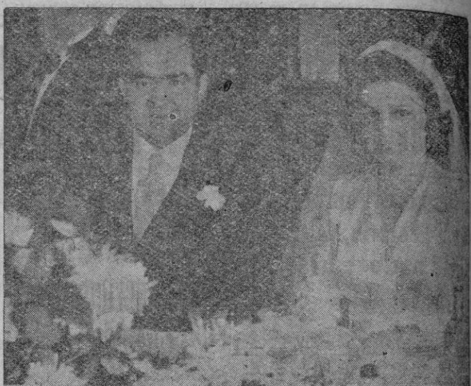
Enlace Suau - Gibert

Llegó ayer en avión Excmo. Sr. General segundo