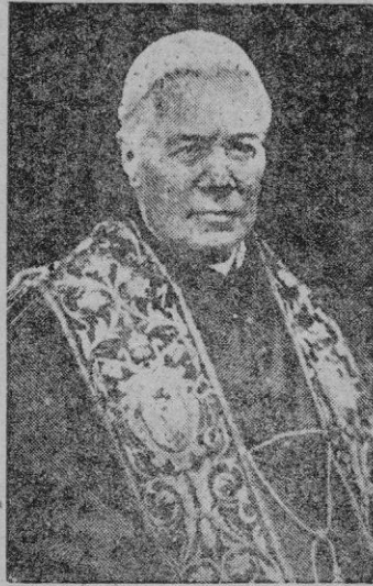
El Papa Pío X, Patrono del siglo XX de la Cofradía de la Doctrina Cristiana

La Cofradía tiene en los Estados Unidos una constitución y