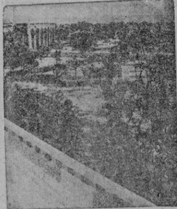
Una panorámica del Agro Pontino, donde vivía María Goretti

ca nos habíamos imaginado un asesino tan manso, tan humilde, tan amable. Ciertamente que no hemos de olvidar la obra de la gracia, pero siempre será cierto que "genio y figura hasta la sepultura", y el genio de Alejandra es apaci-