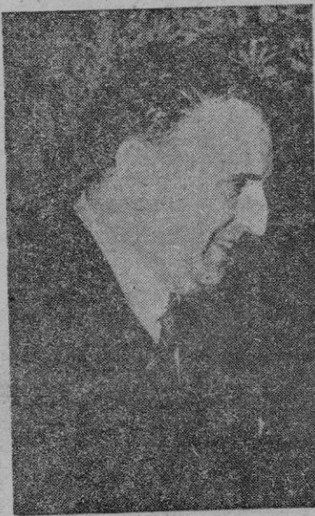
El Ministro de Asuntos Exteriores

vienen recibiendo de los poderosos ayudas cuantiosísimas, que han hecho posible su recuperación económica. Mientras tanto nuestra Patria, por pesar sobre ella el veto ruso se ha tenido que valer de sus propios medios con lo cual su resurgimiento no ha podido seguir el ritmo de las demás naciones.