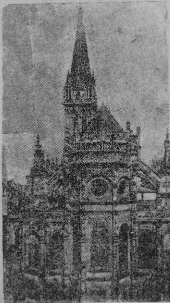
La iglesia de San Pedro de Caen, ciudad que sufrió enormes daños

En abril, cuando el general Speidel fué nombrado jefe de Estado Mayor de Rommel, Strolin halló en él un nuevo aliado,