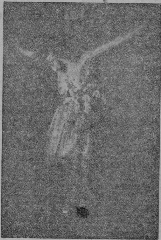
Venerable figura del Santo Cristo dels Boters que se conserva y venera en San Juan de Malta.

En el domingo siguiente a la festividad de San Juan seguía se cantando oficio solemne para los cofrades difuntos en el siglo pasado, según hemos vis