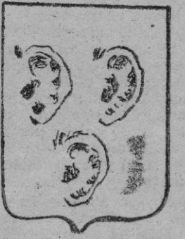
Armas y escudos de los toneleros y corredores de oreja

reservado. Una comida de fraternidad y varios jolgorios populares completaban el programa de las fiestas patronales" (2).