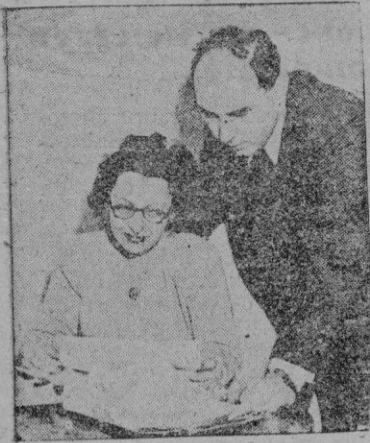
Fotografía de los Sulner, tomada en el Cuartel General de los Servicios de Inteligencia americanos, examinando el microfilm extraído de Hungría por el agente de una "potencia occidental", en los días en que el matrimonio planeaba la huida.

El Politburó húngaro, apremiado por el moscovita, necesitaba pruebas escritas para dar al proceso apariencias legales y para la propaganda