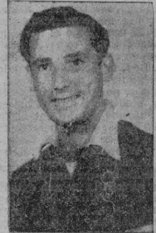
TROBAT, el algaidense que correrá la Vuelta a España