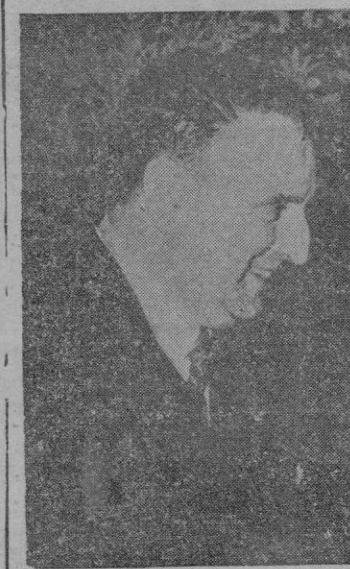
Exteriores señor Martín Artajo ha dirigido por radio el siguiente mensaje difundido por la emisora nacional. Españoles y ecuatorianos: "El (Continúa en última pág.)

MADRID, 7 (Efe). — Con motivo de la canonización de Santa María de Quito, que se celebrará en Roma el próximo domingo, el ministro de Asuntos