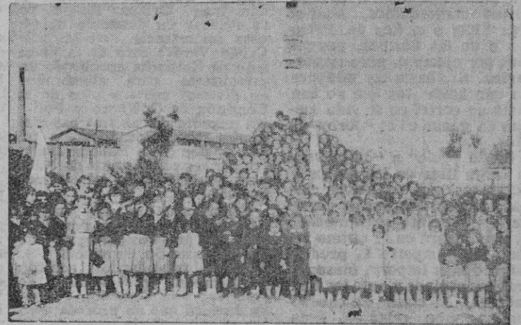
Niños reparadores momentos antes de la celebración de la tarde literario-musical, habida en el Salón del Patronato Obrero, día 13 del mes en curso, junto a la Cruz de la Plaza del General García Ruiz

Seguid, Niños Reparadores, con vuestra conducta, digna de toda loa, y con vuestro índice enseñando al Sagrario a los distraídos, decid muy de corazón y muy quedito, al pasar por ante el Tabernáculo: "Corazón de mi Jesús, que los hombres todos se den cuenta