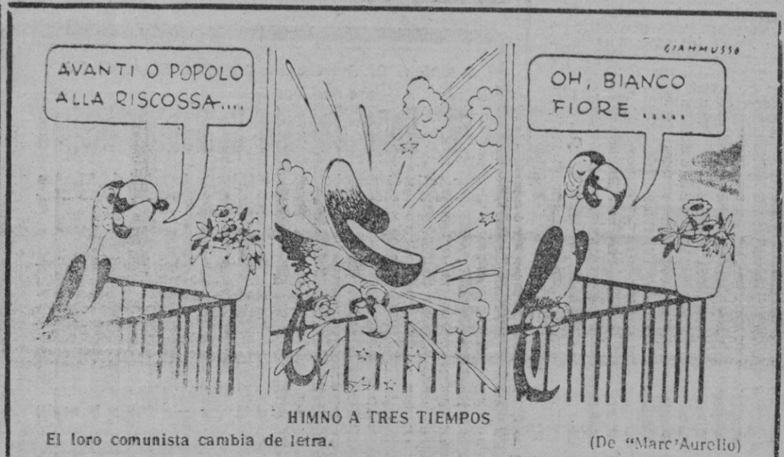
El loro comunista cambia de letra.

Vichinsky y su comitiva pascaron a gran velocidad por el silencio de Den Linden, ante una atmósfera silenciosa.