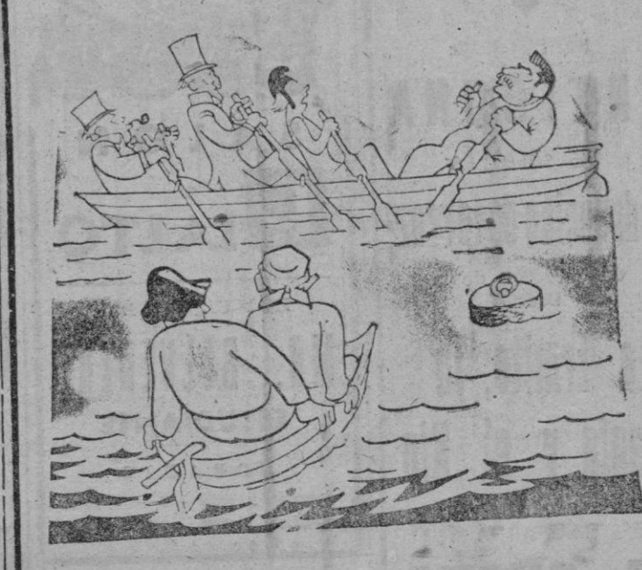
—ESTA BARCA NO AVANZA, —ES QUE HAY UN REMERO DEL VOLGA, QUE BOGA CONTRA DIRECCION