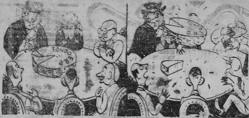
JON BULL: Yo corto mi parte... y el resto para Vds.