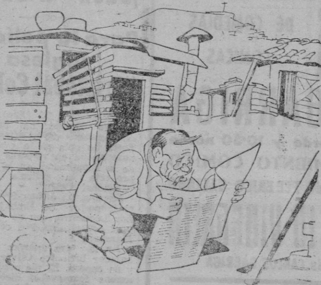
—¡Vaya problema si la reconstrucción de Europa empezara por aquí!