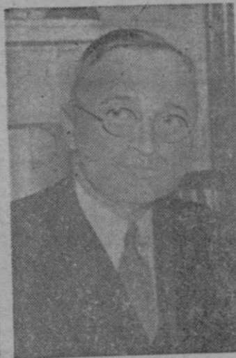
EL PRESIDENTE TRUMAN

Unidos haya sido informado por el inglés sobre esta noticia.