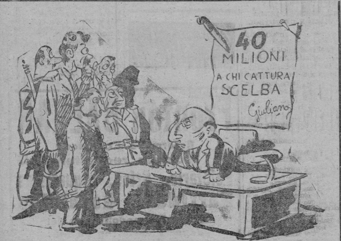
El ministro del Interior, Scalba. — Y bien? ¿Todavía no se ha recibido ninguna respuesta a la oferta de recompensar con veinte millones de liras la captura del bandido Giuliano.