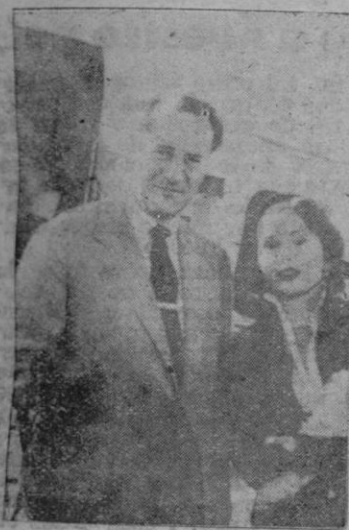
George Sanders y su esposa posando para "Correo de Mallorca" momentos después de su llegada a Palma

Apenas nuestro hombre estuvo aposentado en los mullidos butacones del campo de aviación de Son Bonet, nos pusimos al habla con él siempre dispuestos a averiguar si su mutismo de la llegada era cosa habitual o bien producto de la curiosi-